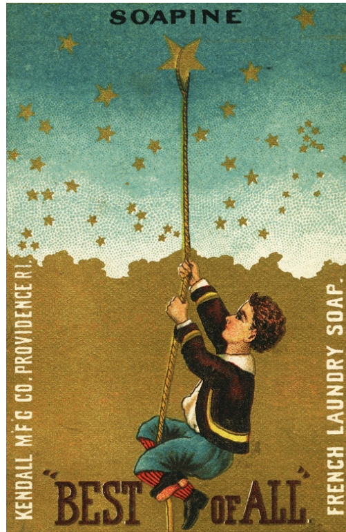
Bambino appeso a una stella, 1880-84