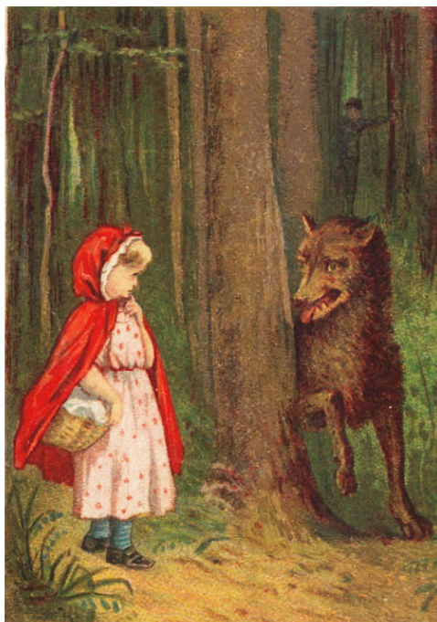
Cappuccetto Rosso, 1877-92, courtesy Comune di Modena, Museo della Figurina - Fondazione Modena Arti Visive

Le illustrazioni senza tempo della Collezione Museo della Figurina sono il punto di partenza di un percorso dedicato alla fiaba e alla capacità delle immagini di raccontare storie.