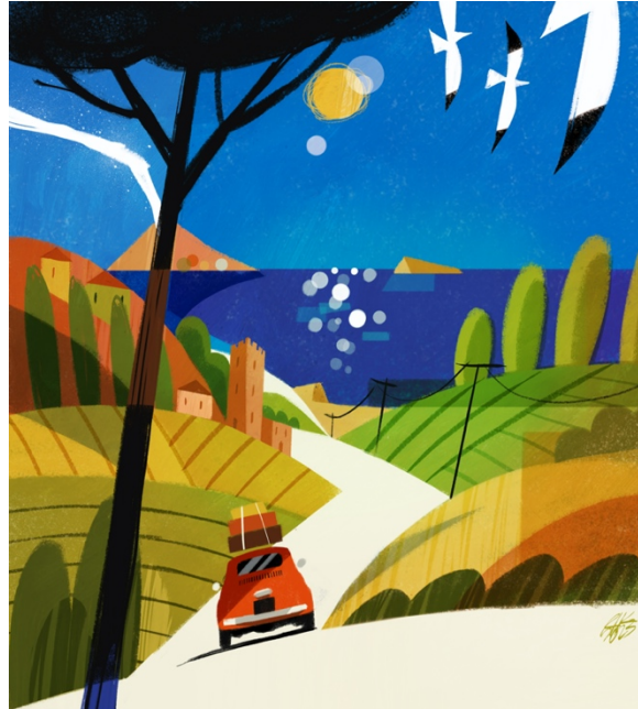
Riccardo Guasco, Regione e sentimento , 2023, Museo della Figurina - Fondazione Modena Arti Visive

Il laboratorio offre un approccio artistico e giocoso alla conoscenza della geografia dell'Italia e delle sue bellezze naturalistiche e culturali, ispirandosi alla mostra Regione e sentimento. Itinerari italiani illustrati dell'illustratore e pittore contemporaneo torinese Riccardo Guasco, noto al grande pubblico per le campagne pubblicitarie di importanti enti culturali e turistici. Affascinato dall'eterogeneo materiale del Museo della Figurina, l'artista si è lasciato ispirare dalla grafica lineare e colorata delle etichette d'albergo - che decoravano le valigie dei primi turisti in giro per l'Europa - per creare all'interno del museo un singolare viaggio in Italia, che attraversa le venti regioni della nostra penisola con illustrazioni e disegni creati per l'occasione, accostati ai materiali turistici originali dei primi decenni del '900. L'osservazione delle grafiche presenti nelle etichette d'albergo sarà inoltre lo spunto per raccontare la ricchezza e l'eterogeneità del nostro Paese e coinvolgere la classe in un'inedita rappresentazione di alcune città italiane.